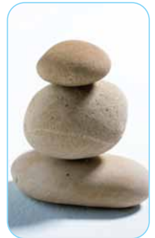
Gánh nặng cho gia đình thay vì chuyến du lịch thú vị

Để chạm lấy những ước mơ của mình, hãy nói cho chúng tôi mục tiêu 6 năm, 7 năm..., hay 10 năm của bạn.