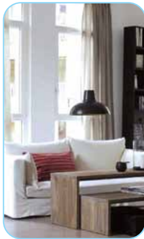
Căn hộ xinh xắn