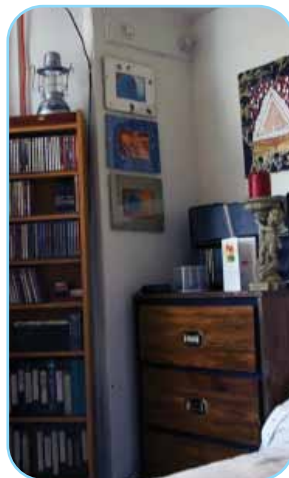
Nhiều trang thiết bị cao cấp nhưng vẫn là căn hộ thuê ngày xưa