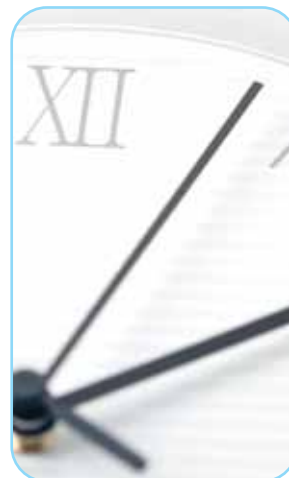
Lễ cưới bị trì hoãn hoặc không như mong đợi