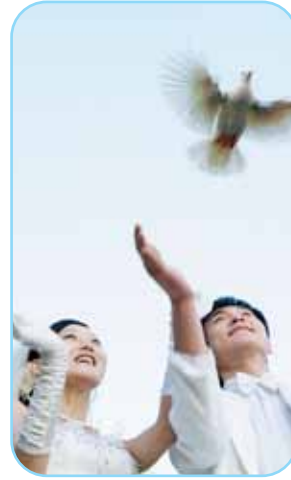
Lễ cưới tung bừng