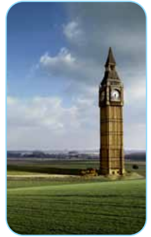
Du lịch cho cả gia đình

Với thu nhập như hiện nay, bạn tin rằng việc đạt được những mục tiêu này sẽ chẳng mấy khó khăn.