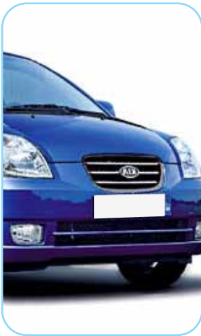
Ô tô đời mới

Vậy mục tiêu của bạn trong 6 đến 10 năm tới là gì?